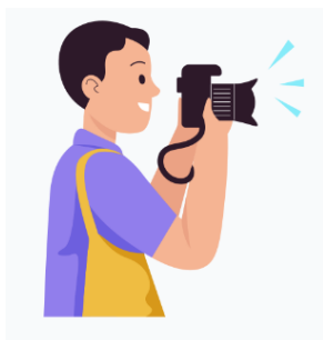
PHOTO DE CLASSE : le bon de commande a été transmis dans le cartable de votre enfant.

Cliquez sur le lien du site https://mppscolaire.maclasse.photo/ avec votre code d'accès ou utiliser le QR code.